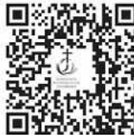
QR-Code: A. Schweizer

In jedem Gottesdienst wird eine CD aufgenommen, diese können Sie gerne beim Pfarramt (Tel. 388) bestellen.