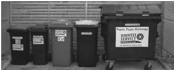
Die Jahres- und Behältergebühren bleiben 2022 stabil.

Weitere Informationen zu den Abfallgebühren sind bei der Abfallberatung unter der kostenlosen Servicenummer 0800 30 30 839, Fax 07452 6006-7777, E-Mail abfallberatung@awb-calw.de oder auch auf der Website des AWB unter www.awb-calw.de erhältlich.