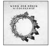
Logo: M. Chrobak

Sonntag, 29.05. , (Wochenspruch): Christus spricht: Wenn ich erhöht werde von der Erde, so will ich alle zu mir ziehen. Johannes 12,32