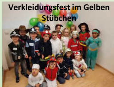
Verkleidungsfest im Gelben Stübchen