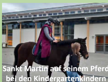
Sankt Martin auf seinem Pferd bei den Kindergartenkindern