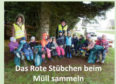
Das Rote Stübchen beim Müll sammeln