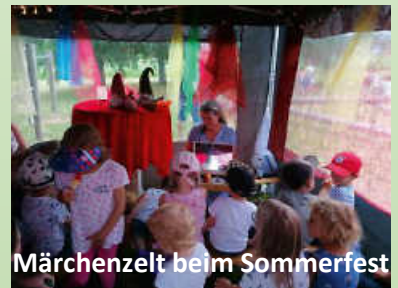
Märchenzelt beim Sommerfest