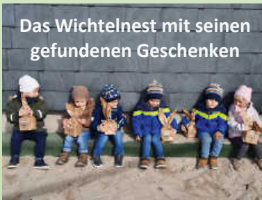
Das Wichtelnest mit seinen gefundenen Geschenken