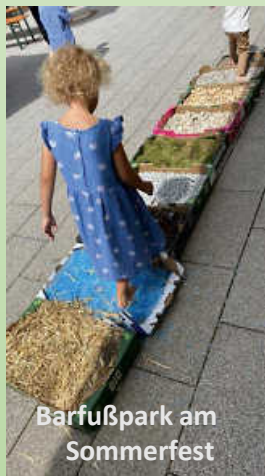
Barfußpark am Sommerfest