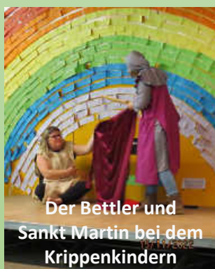
Der Bettler und Sankt Martin bei dem Krippenkindern