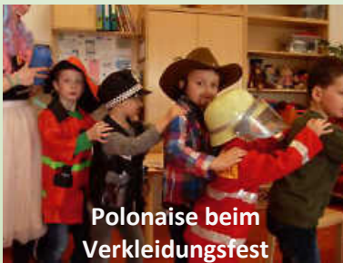
Polonaise beim Verkleidungsfest