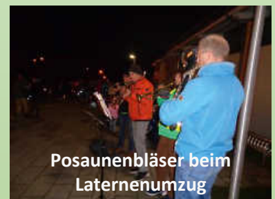
Posaunenbläser beim Laternenumzug