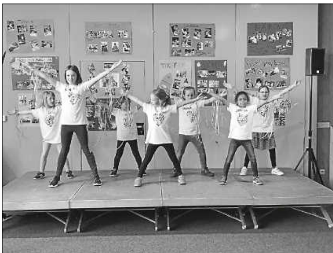
Aerobic Tanz Offene Angebote

Die Zuschauer waren begeistert. „Unglaublich, wie vielfältig und toll das jedes Mal ist“, kommentierte eine Mutter die Präsentation. Die Schüler sehen das sicher genauso und freuen sich auf nächste Mal!