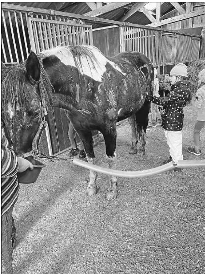
Pferde Offene Angebote