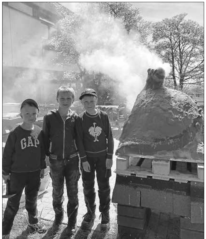
Pizzaofen Offene Angebote