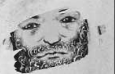
Plakat: B. Seeger

Es lädt ein: der Frauenkreis der Evang. Kirchengemeinde Simmersfeld