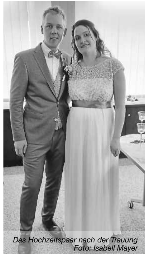
Das Hochzeitspaar nach der Trauung

Dem Hochzeitspaar alles Gute und viel Glück für die gemeinsame Zukunft.