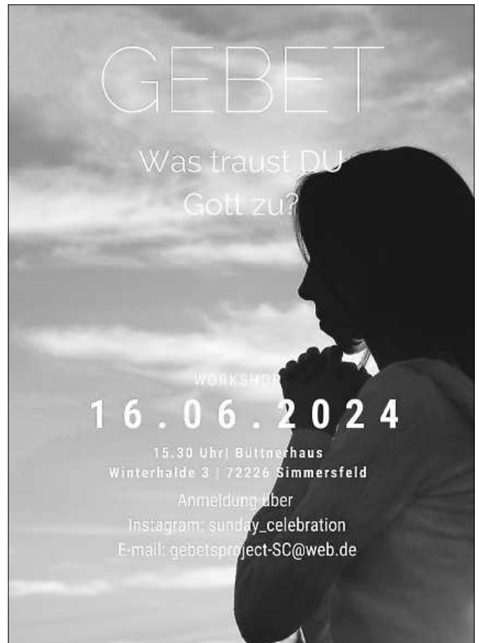
Plakat: S. Renz

13.30 Uhr Wanderung des Frauenkreises durchs Köllbachtal mit anschließendem Kaffee trinken in der Baiermühle Treffpunkt am Büttner-Haus