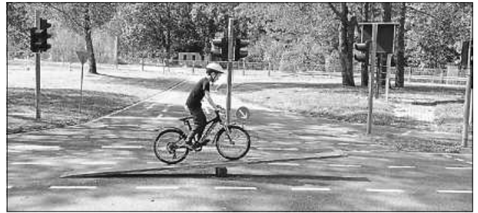
Mit dem Fahrrad ging es unter anderem über eine Wippe