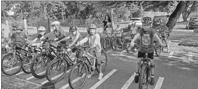
Jedes Kind erhielt ein Fahrrad, das erst richtig eingestellt werden musste

Vielen Dank auch an die Polizisten, die sich viel Mühe gegeben haben.