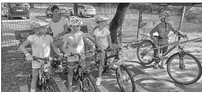
Alle warteten gespannt, bis es losging