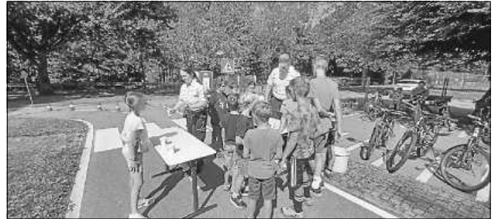
Erklärung des Wasserbecherspiels