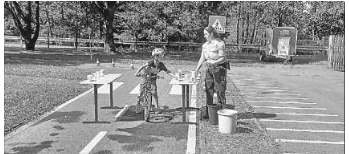
Bei dem Wasserbechertransport war Geschicklichkeit gefragt