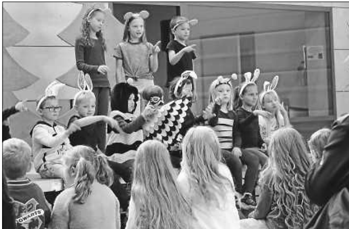
Einschulungsfeier 2024

Bei kühlem Wetter ging es anschließend weiter in die Albblickhalle, wo die Zweitklässler und Lehrer schon gespannt auf die Neuen warteten, um endlich ihr lange geübtes Theaterstück vorführen zu können, in dem der kleine Nils wegen des schönen Wetters seinen ersten Schultag schwänzt und in den Wald geht. Die Schüler der 2a und 2b hatten sich mit niedlichen Kostümen als Bienen, Hasen und Mäuse verkleidet und machten dem kleinen Nils sehr schnell klar, dass es doch nützlich ist, lesen zu können, um z. B. Pilze bestimmen oder den Wetterbericht lesen zu können.