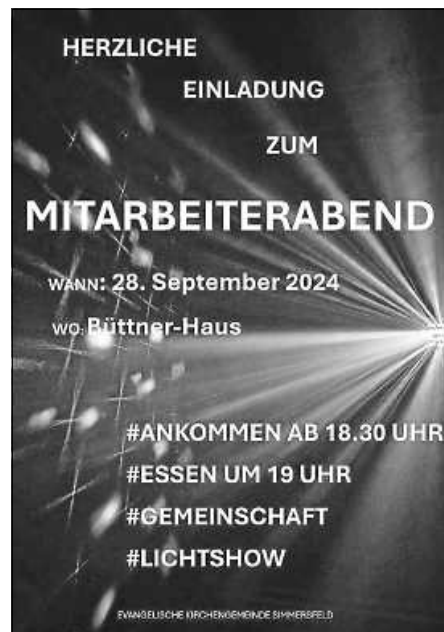
Plakat: B. Dengler

Herzliche Einladung an alle Mitarbeiter und deren Angehörige!