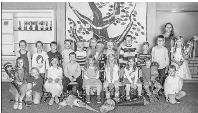
2024 Einschulung Klasse 1

Den Erstklässlern scheint die Einschulung an der Albblickschule gut gefallen zu haben – sie kamen am Montag alle wieder!